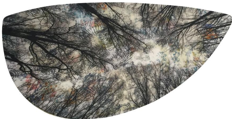
Artista: Manuel Felisi Titolo: Vertigini Dimensioni: 52 x 77 x 40 cm