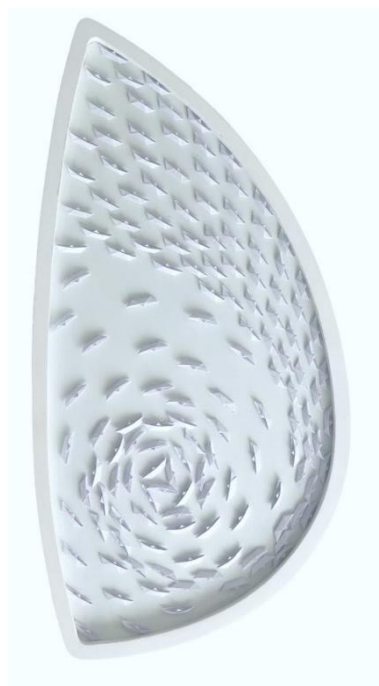
Artista: Riccardo Gusmaroli Titolo: Senza Titolo Dimensioni: 52 x 77 x 40 cm